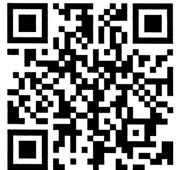
新規登録 QR コード