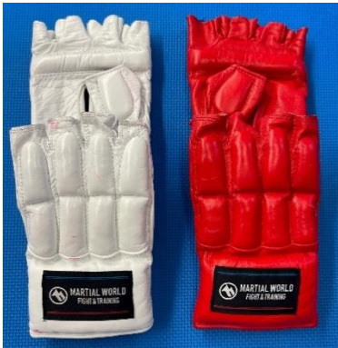
グローブ<着用:高校生・シニア男女>(主催者貸出し)