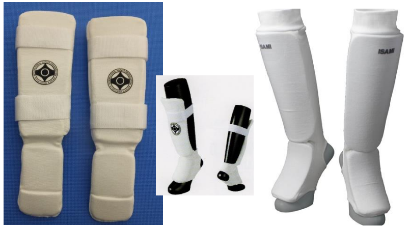
スネサポーター <着用:高校生・シニア男女>(個人で用意)